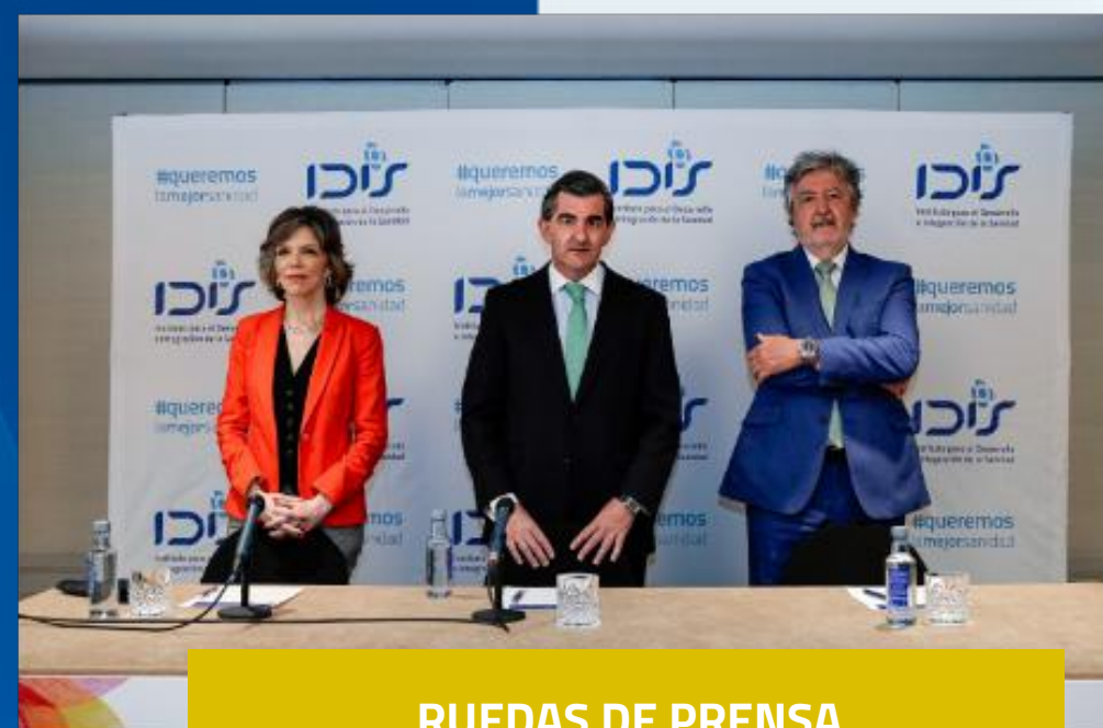
RUEDAS DE PRENSA

Todos sumamos y aportamos valor a la sanidad