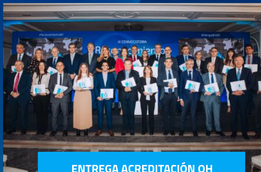
ENTREGA ACREDITACIÓN QH